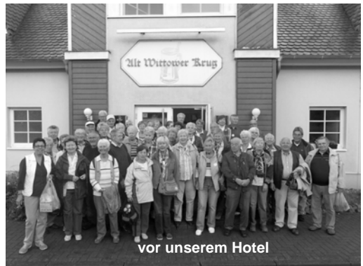
vor unserem Hotel