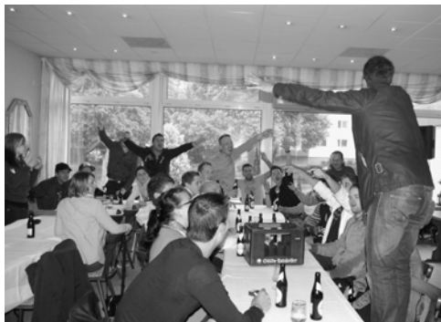
Superstimmung bei der Aufstiegsfeier