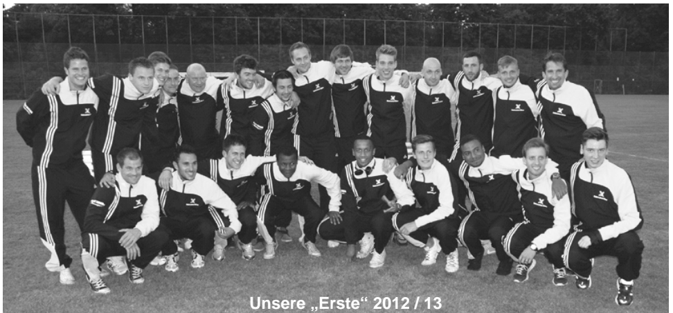
Unsere „Erste“ 2012 / 13

Also, alle die Interesse haben, bitte melden bei: Friedel Krenz (0172-51 00 633) oder Manfred Werner (0173-897 58 59).