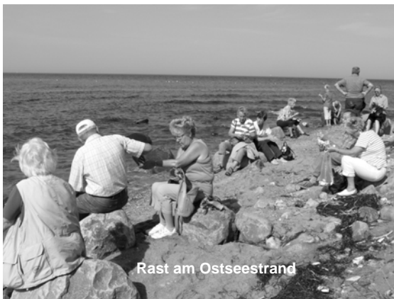
Rast am Ostseestrand

Aus einem ganz anderen Blickwinkel konnten wir die Küste am nächsten Vormittag von Bord der „Nordwind“ genießen. Von Saßnitz aus ging es diesmal per Schiff entlang der wild zerklüfteten Kreidefelsen zum Königsstuhl und wieder zurück - und bei Kaiserwetter wurde auch dieser Ausflug wieder zu einem Erlebnis der besonderen Art. Festtagsstimmung herrschte auch bei den Fischliebhabern zur Mittagszeit. Zander, Pannfisch und frisch gebratene Heringe kamen gut an in dem stilvoll eingerichteten Fischrestaurant am Hafen. Ob sich danach die Gruppe der