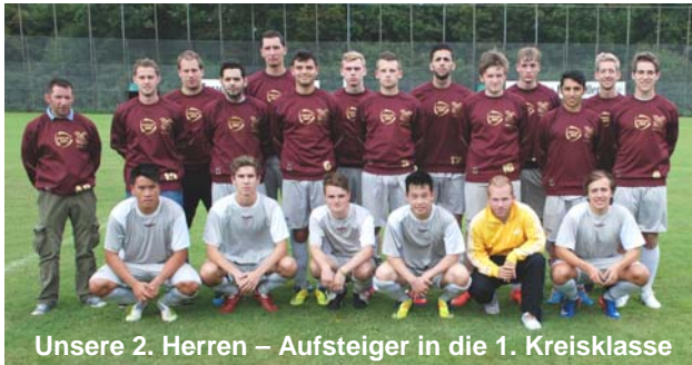
Unsere 2. Herren – Aufsteiger in die 1. Kreisklasse

Eltern-Kind-Turnen Freizeitsport–Laufen–Walking Fußball Gymnastik Kinderturnen Leichtathletik-Laufen Tanzen Tennis Tischtennis Volleyball Wandern