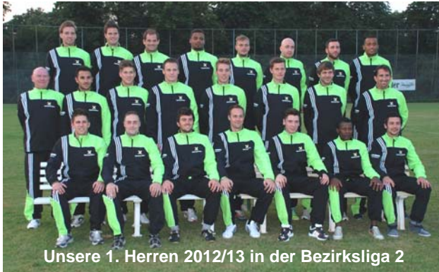
Unsere 1. Herren 2012/13 in der Bezirksliga 2