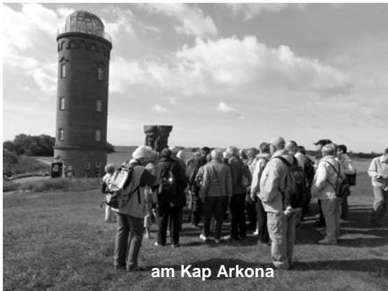
am Kap Arkona

Am nächsten Tag war das Kap Arkona unser Ziel. Die Sonne lachte vom blauen Himmel und wir erwarderten die Steilküste mit ihren vielen wunderschönen Ausblicken bis zum kleinen Fischerdorf Vitt. Fischbrötchen waren vor Ort der große Renner und wer einen Platz im einzigen kleinen Gasthaus fand, konnte sich auch mit einem leckerem Stück Sanddortorte über den Mittagshunger retten. Am Nachmittag stand mit den Kreidefelsen am Königsstuhl die nächste schöne Aussicht auf dem Programm. Bei