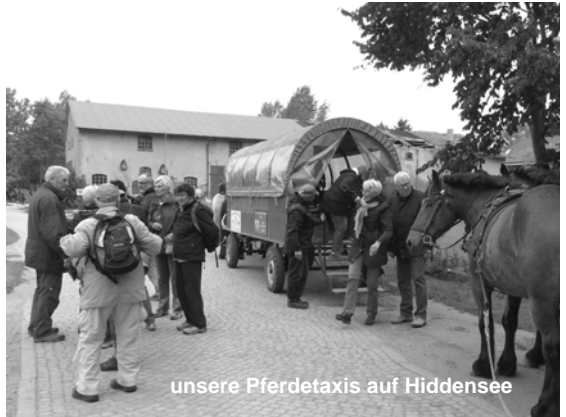
unsere Pferdetaxis auf Hiddensee

Am 6. September ging die Wanderabteilung dann wieder auf große Fahrt. Sieben Tage Insel Rügen mit vollem Programm standen auf dem Terminkalender. Leider mussten zwei Ehepaare kurz vor dem Start noch gesundheitsbedingt absagen und da waren es „nur“ noch 61, die am Donnerstagmorgen erwartungsvoll in unserem großen Bus saßen. Obwohl die Wettervoraussagen gar nicht so rosig aussahen empfing uns Rügen mit Sonnenschein und nach dem die Zimmervereilung geklärt war gab es erst einmal Kaffee und Kuchen. Nach dem anschließenden Ortsrundgang mit dem Dorfpastor und der frischen Brise am Hafen schmeckte das erst Abendessen besonders gut. Durch den etwas unglücklichen Aufbau des Büffets war das „Zulangen“ allerdings nicht ganz stressfrei, - aber am nächsten Abend war das Problem hotelseitig schon gelöst. Nachdem unsererseits dann auch geklärt war wer sich von rechts oder von links in der Schlange anstellt, kam fortan jeder ohne Blessuren an die diversen Fleischtöpfe.